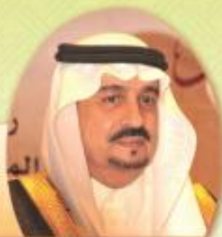
صاحب السمو فيصل بن عبدالعزيز آل سعود الملكعي الأمير أمير منطقة القصيم - الرئيس الفخري للجمعية