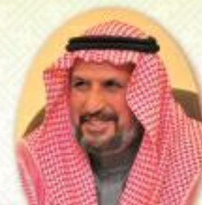
عبد الله يحيى السليم محافظ هيئة السابق لواء طيار ركن - متقاعد